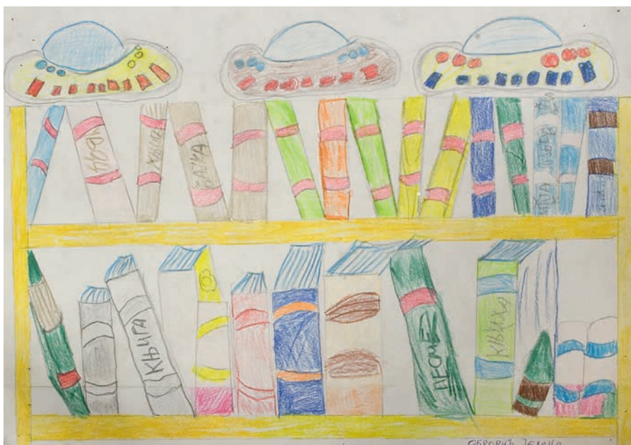
Јелена Оборвић, VII/3 ОШ „Свети Сава”