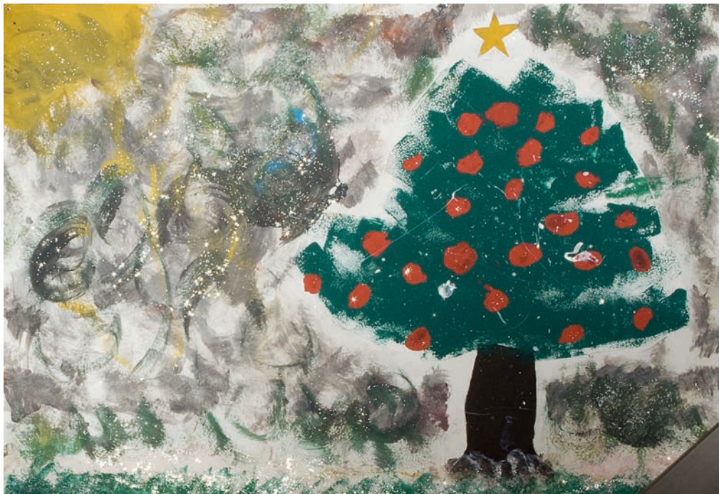
Емилија Зечевић, VII/3 ОШ „Свети Сава”