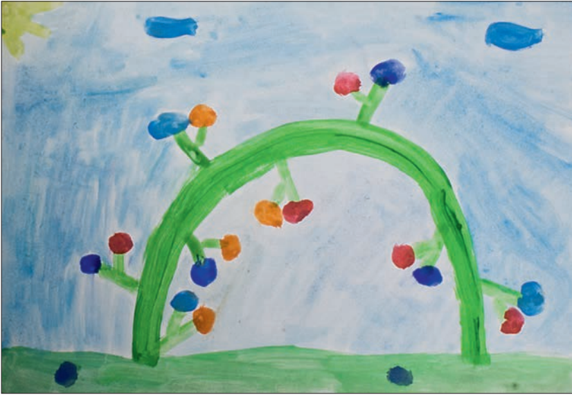
Емилија Николов, III/1 ОШ „Свети Сава”