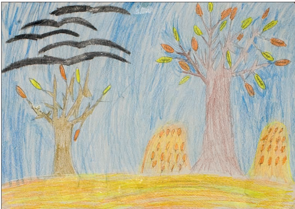
Сйрахиџа Радојковић, IV/2, ОШ „Најшалија Нана Недељковић“