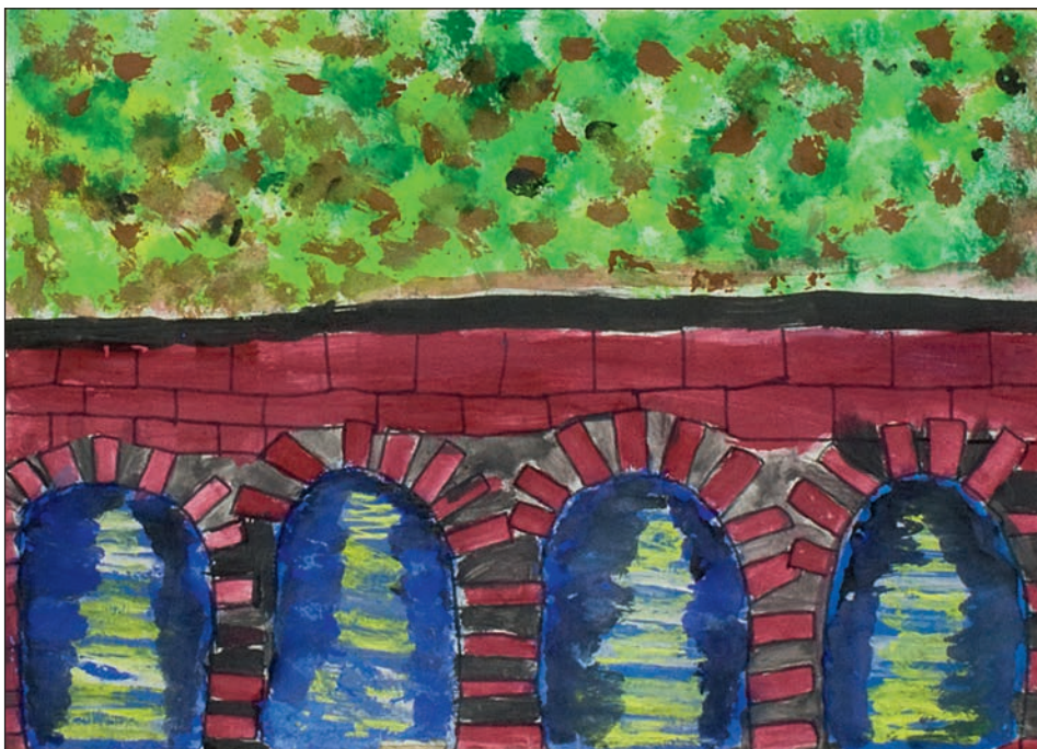
Емилија Зечевић, VII/3, ОШ „Свети Сава“