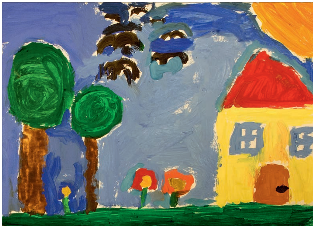
Василије Младеновић, III/1, ОШ „Свеши Сава”